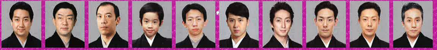
扇 雀 彌十郎 亀 蔵 虎之介 新 悟 松 也 七之助 勘太郎 菊之助 勘三郎