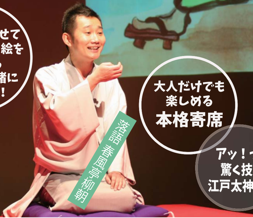
落語 春風亭 柳朝