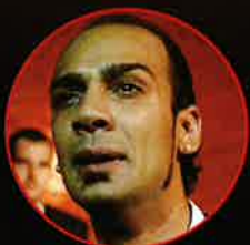
フェルナンド・ソト (歌)