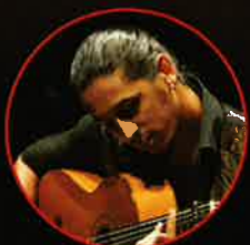
マレーナ・イーホ (ギター)