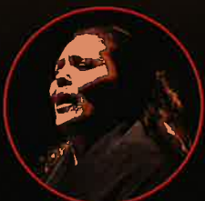
アナ・デ・ロス・レジェス (歌)