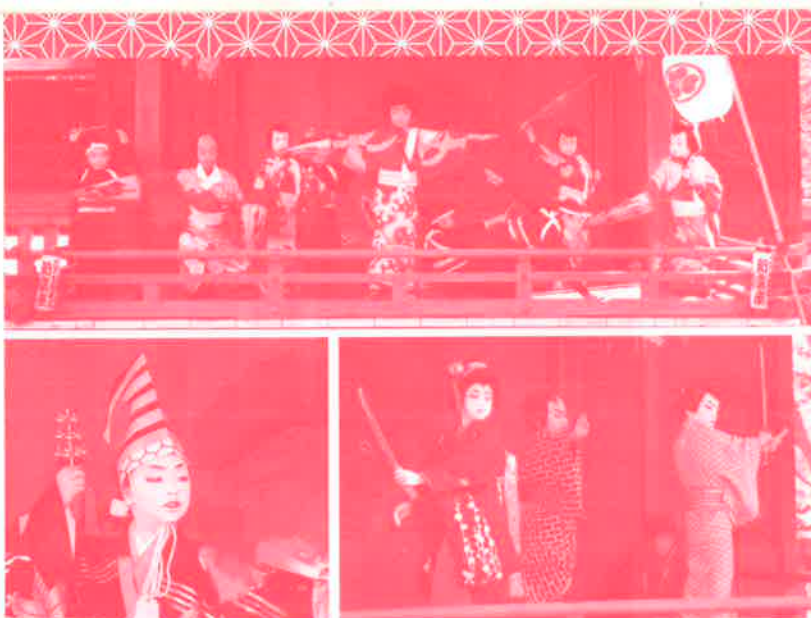
平成22年節分祭公演より